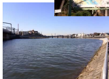
市内南部を流れる安威川（淀川水系 一級河川）