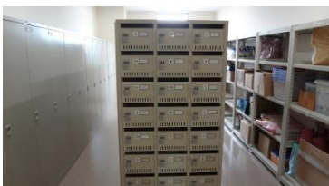
ロッカー・メールボックス・物品棚

ロッカー小(月200円)・ロッカー大(月500円)・ メールボックス(月100円)・物品棚(月400円) ご希望の団体はラコルタまでお申込みください。