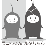
ラコちゃん ルタちゃん