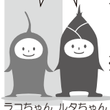
ラコちゃん ルタちゃん

※ラコルタ（吹田市立市民公益活動センター）では、サービス提供およびその向上を目的として個人情報を提供いただいております。提供された個人情報は、その目的以外の用途には利用いたしません。