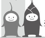
ラコちゃん ルタちゃん

※ラコルタ（吹田市立市民公益活動センター）では、サービス提供およびその向上を目的として個人情報を提供いただいております。提供された個人情報は、その目的以外の用途には利用いたしません。