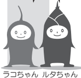
ラコちゃん ルタちゃん

※新型コロナウイルス感染症拡大防止のため、参加にあたってはマスクの着用をお願いします。