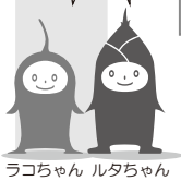
ラコちゃん ルタちゃん

※ラコルタ（吹田市立市民公益活動センター）では、サービス提供およびその向上を目的として個人情報を提供いただいております。提供された個人情報は、その目的以外の用途には利用いたしません。