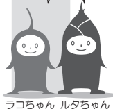
ラコちゃん ルタちゃん

※ラコルタ (吹田市立市民公益活動センター) では、サービス提供およびその向上を目的として個人情報を提供いただいております。提供された個人情報は、その目的以外の用途には利用いたしません。